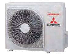
SRC 63~71 ZTL-W